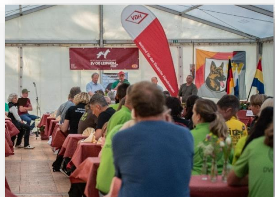
Mit der Auslosung im Festzelt wird die RHDM eröffnet

Von den ursprünglich 82 gemeldeten Teilnehmern nahmen leider nur 64 Teams aus 4 Ländern am Wettkampf teil.