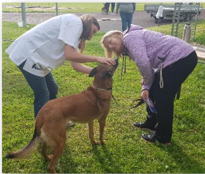
Tierärztliche Kontrolle der teilnehmenden Hunde.

In der Vorbereitungsphase zeichnete sich der Ausrichter der RHDM durch eine immer aktuelle und professionelle Homepage aus. Auch die Probleme bei der Beschaffung der Geländeflächen, die Sorge um die finanziellen Belastungen und die international oftmals schwierigen Meldegrundlagen brachten Unruhe in die Gruppe. Letztlich wurde dank des Engagements eines guten Teams alles bis zum letzten Tag vor der Veranstaltung gemeistert. Als VDH-Veranstaltungsleiter habe ich gern dieses Team unterstützt und danke für die Zusammenarbeit.