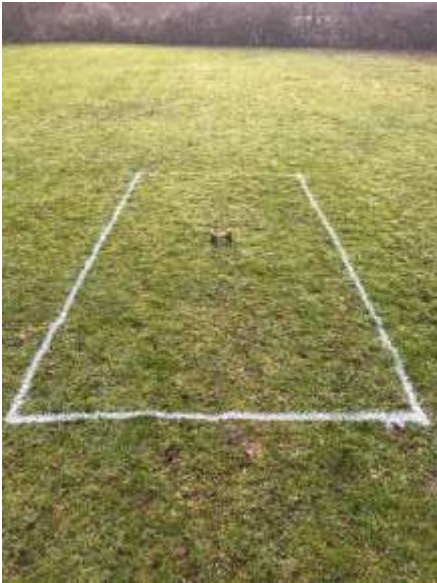
Rechteck 2x4 m