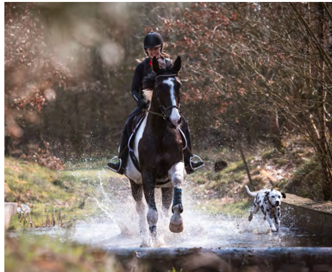
Reitbegleithunde | Seite 20