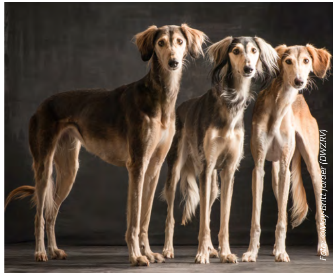
Saluki | Seite 6