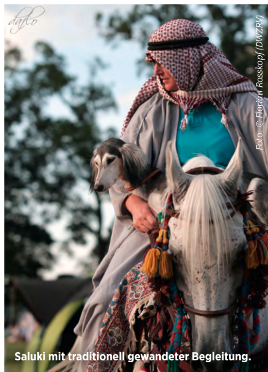
Saluki mit traditionell gewandeter Begleitung.

D er kostbare Vierbeiner, der allenfalls als Ehrengeschenk den Besitzer wechselte, sollte schließlich ausgeruht die Verfolgung der Beute aufnehmen, sobald der Jagdfalke das Wild in Bewegung versetzte. Ein ergreifendes Bild, doch heute kaum praktikabel. Wobei Salukis an der Seite der Pferde, als unermüdliche Begleiter bei langen Ausritten, durchaus auch heutzutage eine gute Figur machen. Und vor allem ermöglicht das, dem enormen Bewegungsbedürfnis der Rasse nachzukommen.