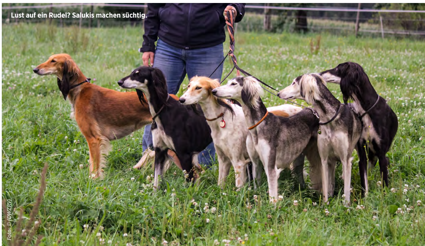
Lust auf ein Rudel? Salukis machen süchtig.

Das Erscheinungsbild des Salukis ist seit Jahrtausenden ähnlich, wobei es schon unterschiedlich geprägte Typen gibt. Das liegt an dem riesigen Verbreitungsgebiet, aus dem Salukis ursprünglich stammen: Man schätzte sie unter anderem in der Türkei, dem Iran, dem Irak, in Saudi-Arabien und in Syrien. In Europa sind sie seit 1910 bekannt. Dennoch eint sie alle diese einmalige Saluki-Ausstrahlung, diese Verschmelzung von Unnahbarkeit und liebevoller Zuwendung, von Eigenständigkeit und Anschlussbereitschaft... und nicht zuletzt ihr aufsehenerregender Look, der die arabische Welt geradezu in Verückung versetzt: „Der Saluki ist kein Hund. Er ist ein Geschenk Allahs, dem Menschen zur Freude und Nutzen gegeben.“ - Vorausgesetzt, man beherrscht die Kunst des Umgangs mit ihm.