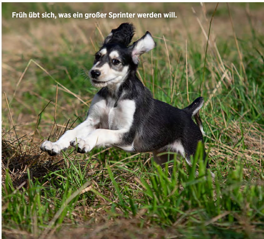
Früh übt sich, was ein großer Sprinter werden will.