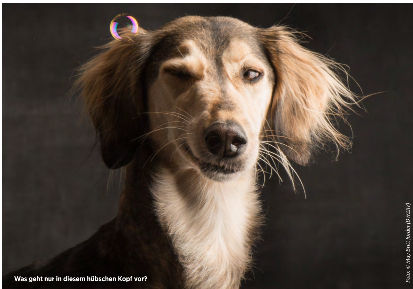
Was geht nur in diesem hübschen Kopf vor?