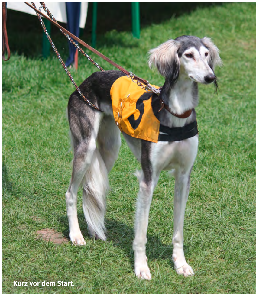
Kurz vor dem Start.