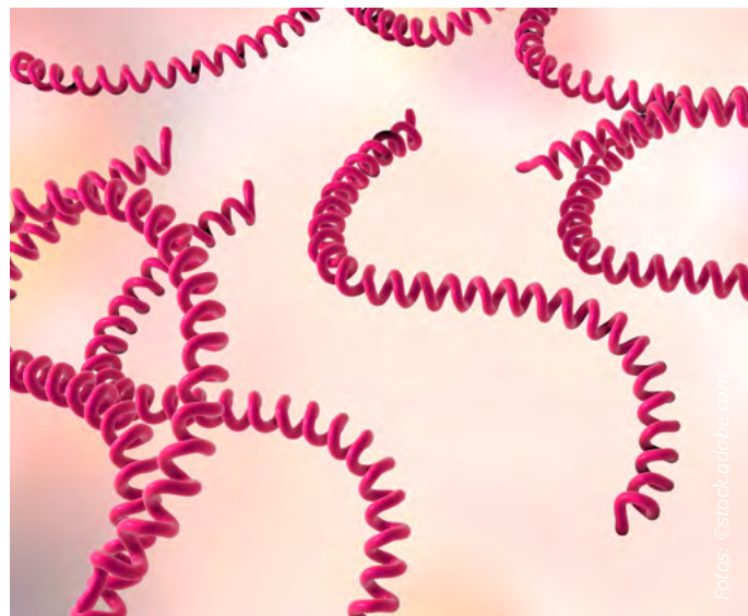
Leptospirose | Seite 50