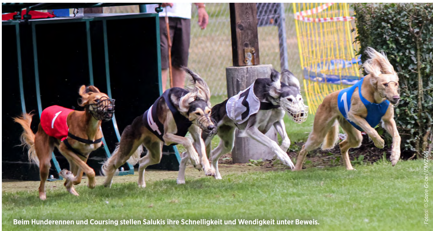
Beim Hunderennen und Coursing stellen Salukis ihre Schnelligkeit und Wendigkeit unter Beweis.

Sowohl das eine als auch das andere sind fraglos die Freizeitbeschäftigungen, die dem natürlichen Bewegungsbedürfnis des Solojägers am allermeisten entgegenkommen. Das Training erfolgt traditionell jedoch ausschließlich von April bis Oktober, womit über die Wintermonate auf jeden Fall ein bewegungsfreudiges Alternativprogramm anstehen sollte. Es gibt inzwischen auch Vereine und Veranstaltungen in den Win-