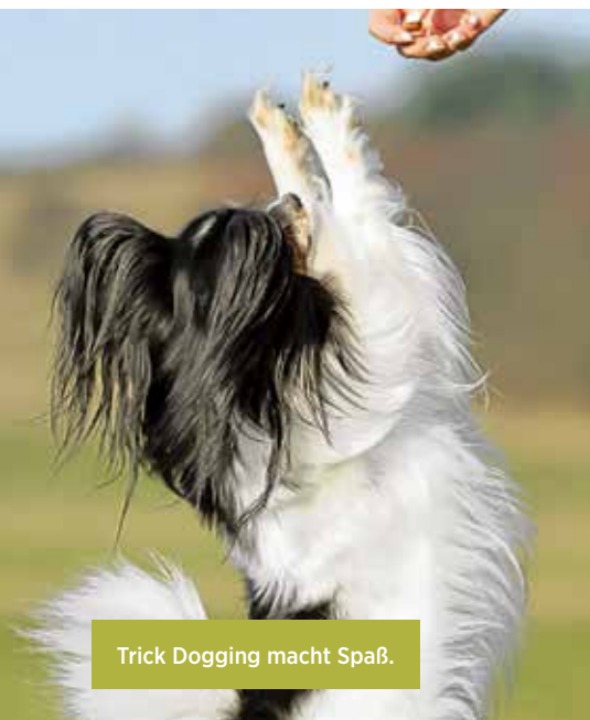
Trick Dogging macht Spaß.