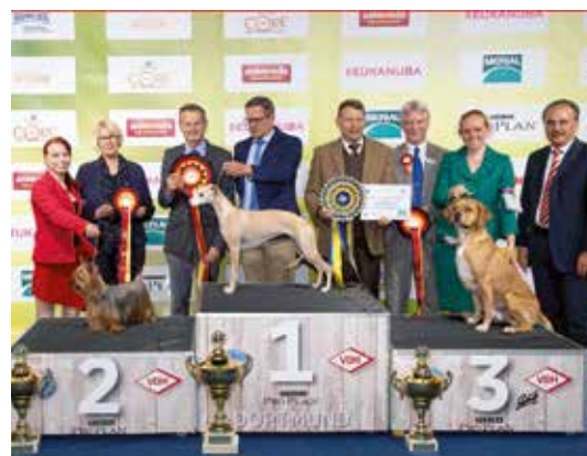
Hund & Katz Dortmund – Seite 32