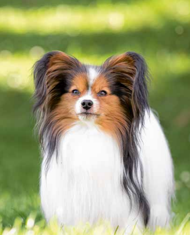
Die weiße Blesse verstärkt den Schmetterlingseffekt.

F ranzosen bezeichnen den Schmetterling als Papillon und den Nachtfalter als Phalène. Was das mit Hunden zu tun hat, genauer mit zwei lebenslustigen Rassevarietäten, ist schnell erklärt. Denn die stehohrige Variante des Kontinentalen Zwergspaniels erinnert aufgrund der großen hoch angesetzten Ohren – in einem Winkel von 45 Grad - tatsächlich an zwei herrlich ausgebreitete Schmetterlingsflügel. Ein Effekt, den die weiße Blesse, die das Gesichtsfeld mancher Papillons exakt in zwei Hälften unterteilt, wirkungsvoll unterstreicht. Und die Flügel des Nachtfalters weisen nach unten. Genau wie die Ohren des zauberhaften Phalène.