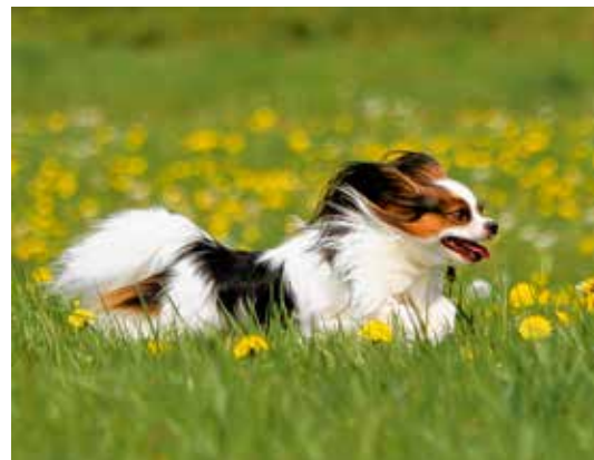
Papillon und Phalène – Seite 6