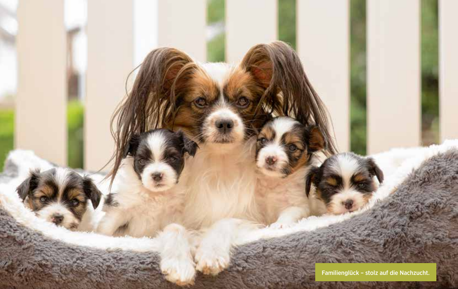
Familienglück – stolz auf die Nachzucht.