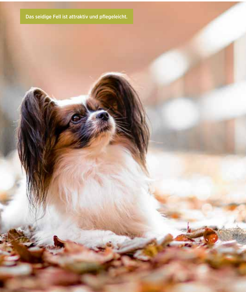
Das seidige Fell ist attraktiv und pflegeleicht.