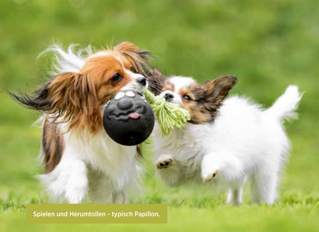
Spielen und Herumtollen - typisch Papillon.