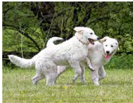
Kuvasz-Vereinigung Deutschland e.V. – Seite 6