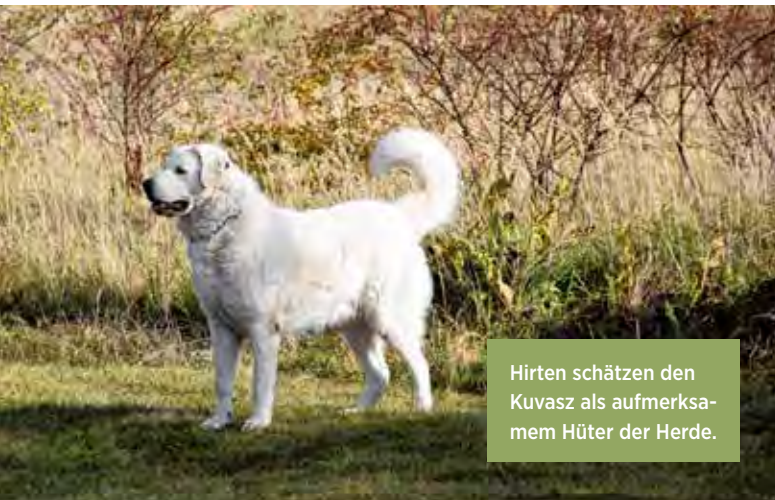
Hirten schätzen den Kuvasz als aufmerksamem Hüter der Herde.