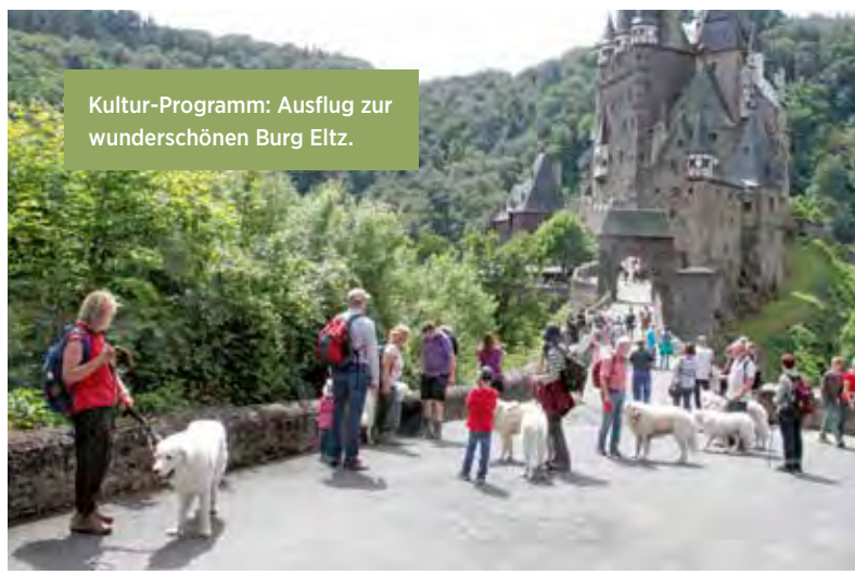
Kultur-Programm: Ausflug zur wunderschönen Burg Eltz.