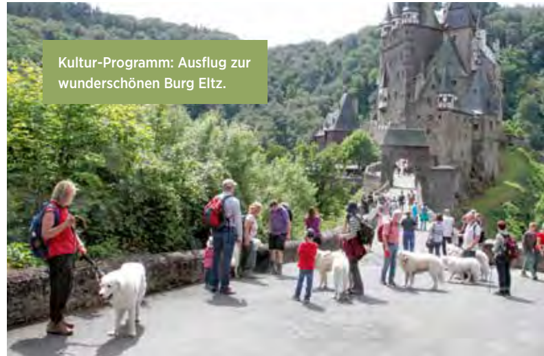
Kultur-Programm: Ausflug zur wunderschönen Burg Eltz.