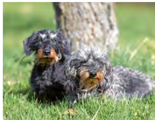
Graue Schnauzen – Seite 28