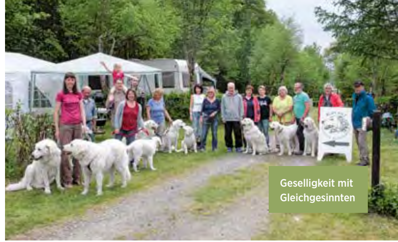
Geselligkeit mit Gleichgesinnten