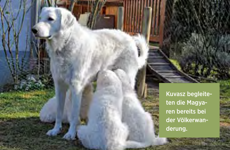
Kuvasz begleiteten die Magyaren bereits bei der Völkerwanderung.