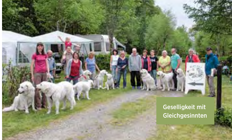
Geselligkeit mit Gleichgesinnten