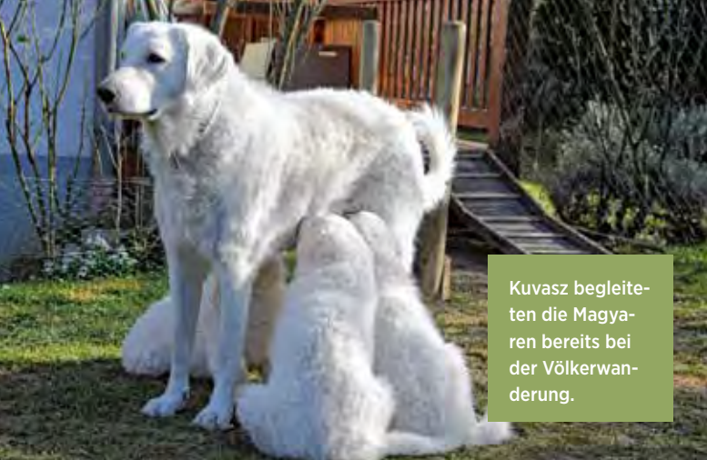
Kuvasz begleiten die Magyaren bereits bei der Völkerwanderung.