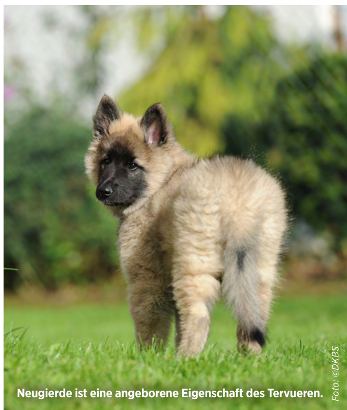
Neugierde ist eine angeborene Eigenschaft des Tervueren.