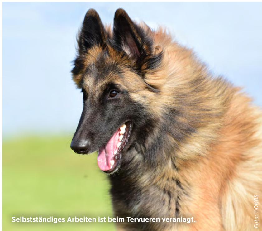
Selbstständiges Arbeiten ist beim Tervueren veranlagt.

Auch wenn das Potenzial für selbstständiges Arbeiten bei Belgischen Schäferhunden veranlagt ist, bleibt ein enger Familienkontakt überaus wichtig für den Tervueren, der sich Fremden gegenüber in der Regel neutral verhält. Aufdringlichkeit oder gar Ängstlichkeit sind jedenfalls unerwünscht. Die Stimmung des schönen Belgiens ist leicht zu erkennen, denn seine Mimik ist durchaus ausgeprägt. Das gilt auch für seine Körpersprache, die sich – mit etwas Erfahrung – vergleichsweise leicht lesen lässt.