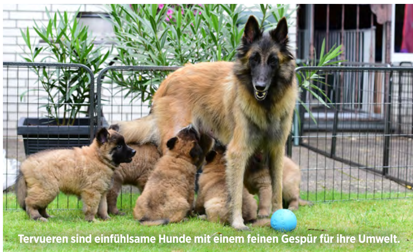
Tervueren sind einfühlsame Hunde mit einem feinen Gespür für ihre Umwelt.

Tervueren sind anpassungsfähige, lernfreudige aber auch empfindsame Hunde mit einem feinen Gespür für ihre Umwelt.