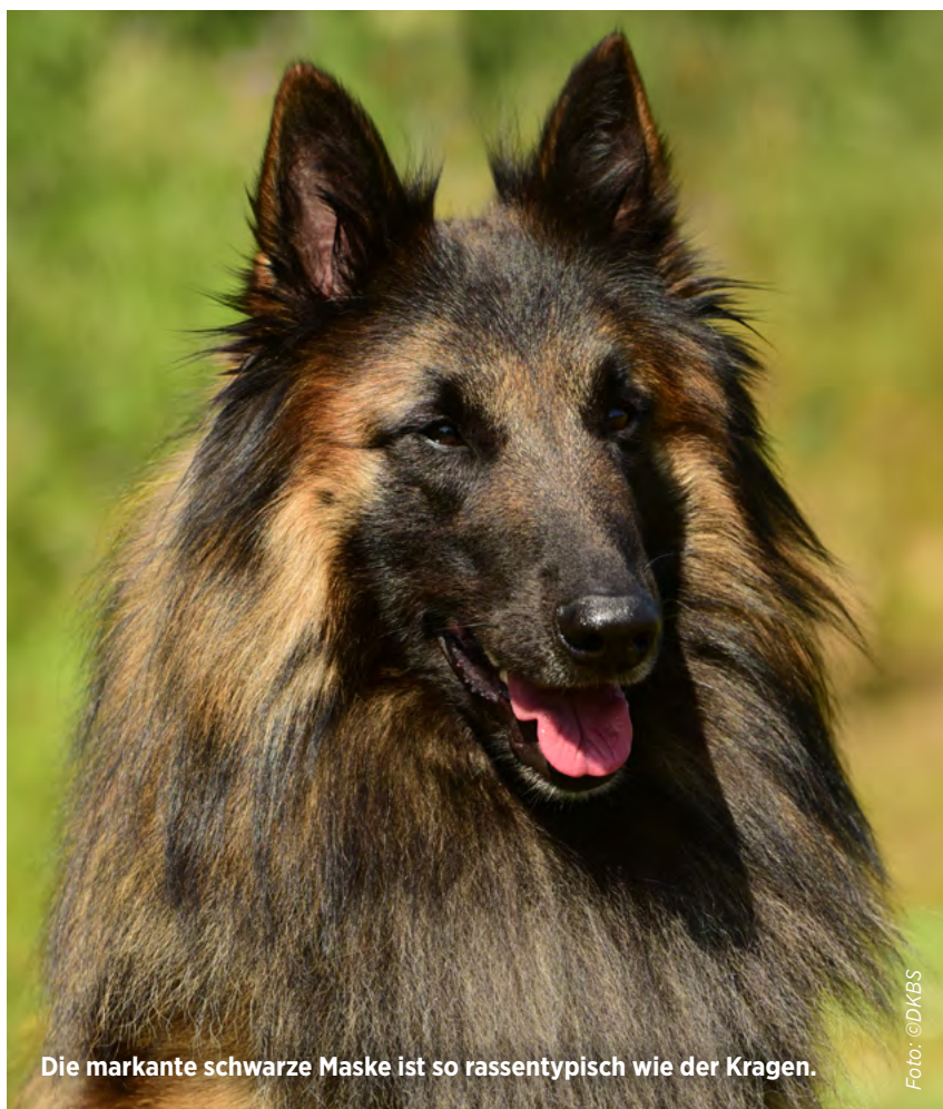
Die markante schwarze Maske ist so rassentypisch wie der Kragen.