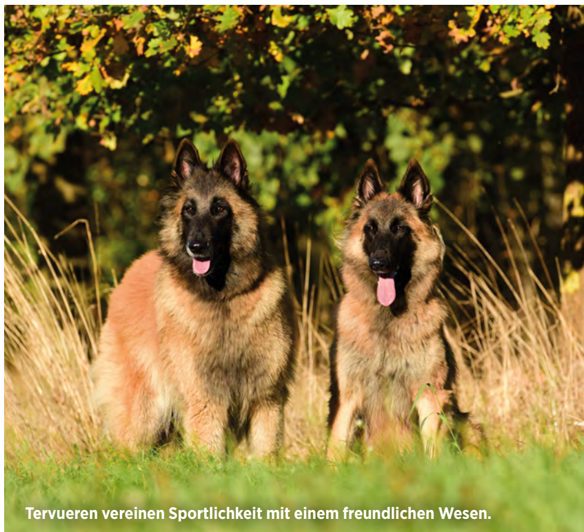
Tervueren vereinen Sportlichkeit mit einem freundlichen Wesen.