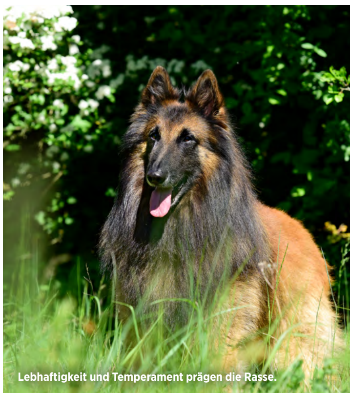
Lebhaftigkeit und Temperament prägen die Rasse.

Tervueren sind anpassungsfähige, lernfreudige aber auch empfindsame Hunde mit einem feinen Gespür für ihre Umwelt. Ihnen entgeht nichts und sie nehmen Stimmungsschwankungen ihrer Bezugspersonen deutlich wahr. Ihre Spontanität ist dabei ebenso eindrucksvoll wie ihre Instinkte, die sogar Stoffwechselstörungen bei kranken Menschen erkennen und anzeigen können. Ein freundliches Wesen vereint sich beim Belgier mit Lebhaftigkeit und Temperament. Die Spielfreude des Tervueren bleibt häufig bis ins hohe Alter erhalten, was auch für seine angeborene Neugierde gilt zutrifft. Deshalb gilt in der goldenen Lebensphase: Ein Tervueren steht mit allen vier Pfoten mitten im Leben und das auch als Seniorhund!