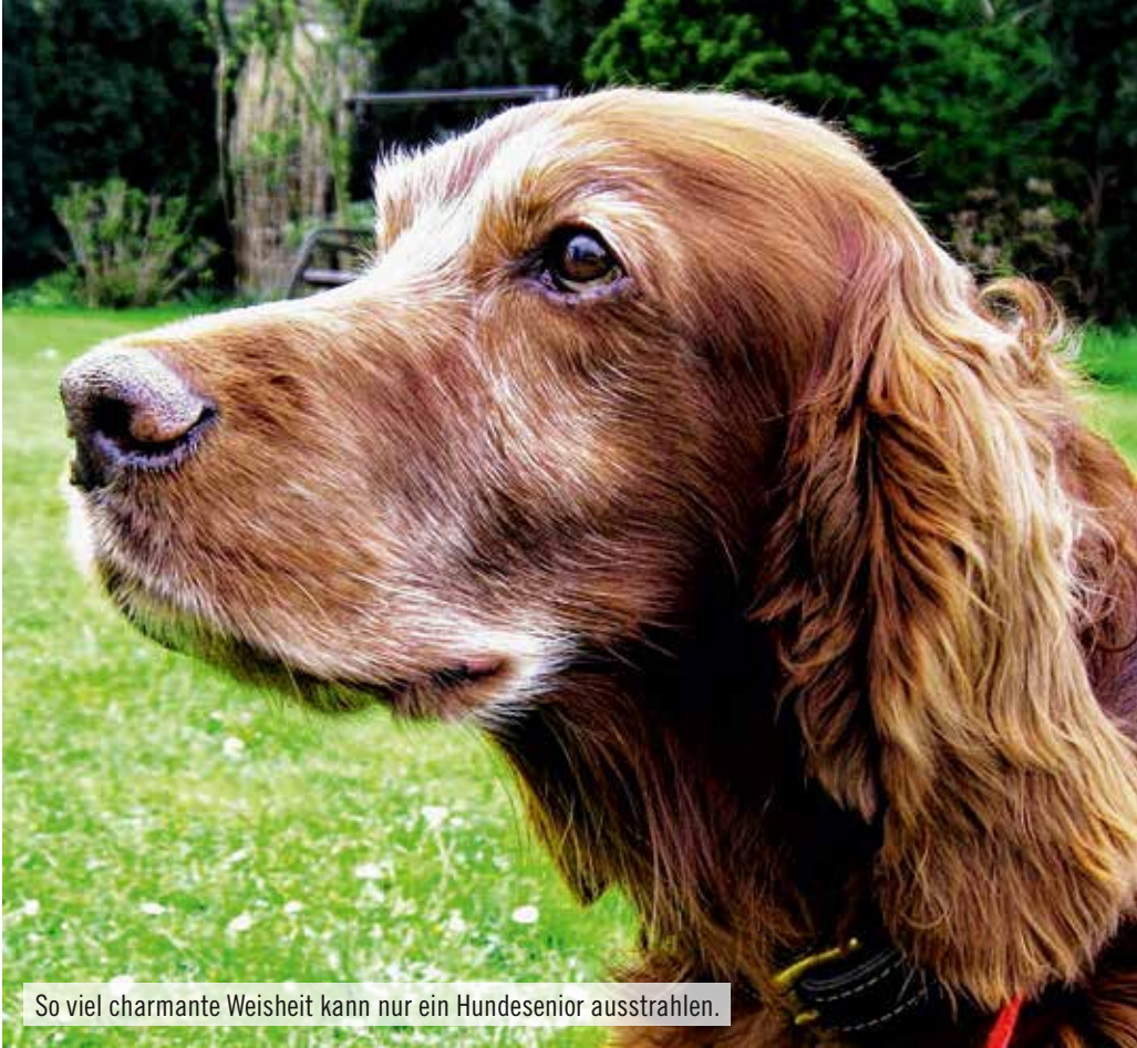
So viel charmante Weisheit kann nur ein Hundeseniore ausstrahlen.