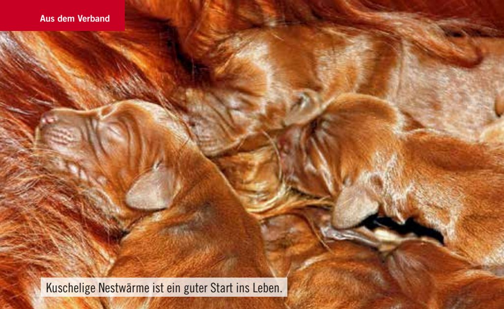
Kuschelige Nestwärme ist ein guter Start ins Leben.