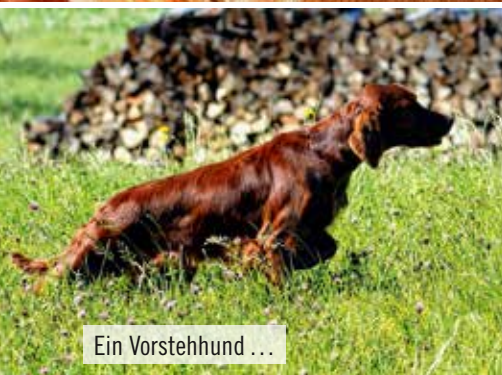
Ein Vorstehhund ...