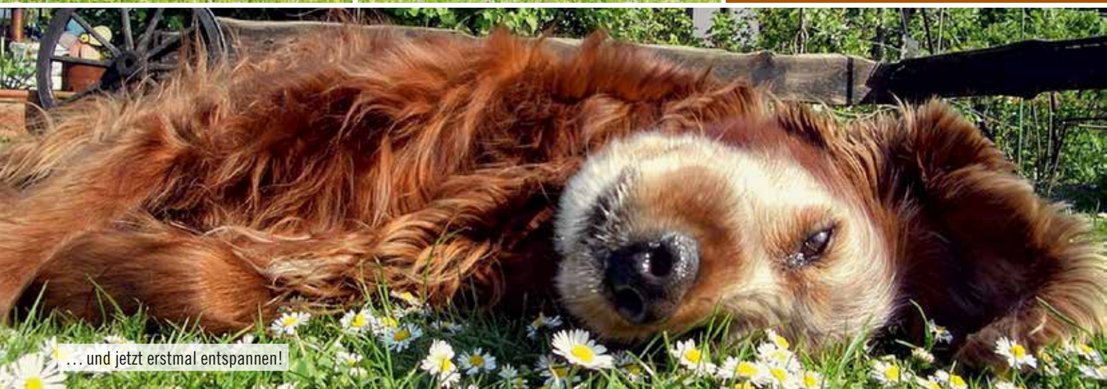
... und jetzt erstmal entspannen!