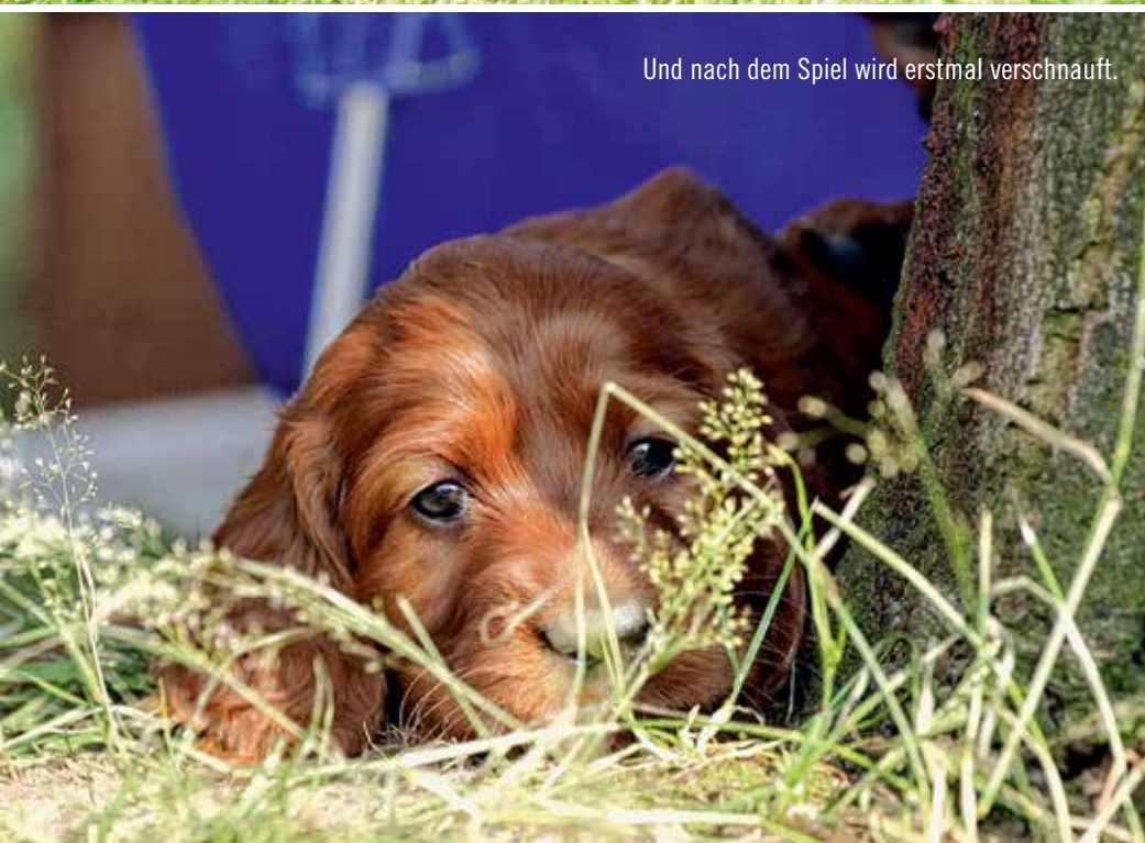
Und nach dem Spiel wird erstmal verschnauft.

Er ist atemberaubend attraktiv. Sein Augen- ausdruck ist von Sanftheit und Intelligenz geprägt. Das lange, kastanienfarbene Haar- kleid erinnert an kostbare Seide. Der Irish Red Setter gehört sicherlich zu den ansprechends- ten Hunderassen überhaupt und lässt das Herz von Hundefreunden weltweit höher schlagen. Er ist der bekannteste englische Vorstehhund und somit weitaus häufiger anzutreffen als English oder Gordon Setter. Solch ein Hund hat einen besonderen Fokus verdient und den bietet ihm innerhalb des VDHs und JGHVs ein Club, der sich auf den attraktiven Roten spezialisiert hat.