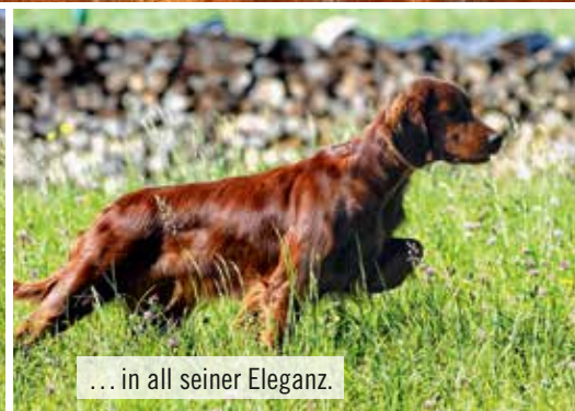
... in all seiner Eleganz.