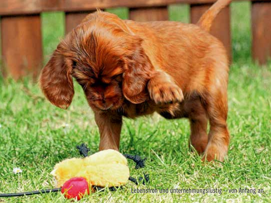
Lebensfroh und unternehmungslustig – von Anfang an.